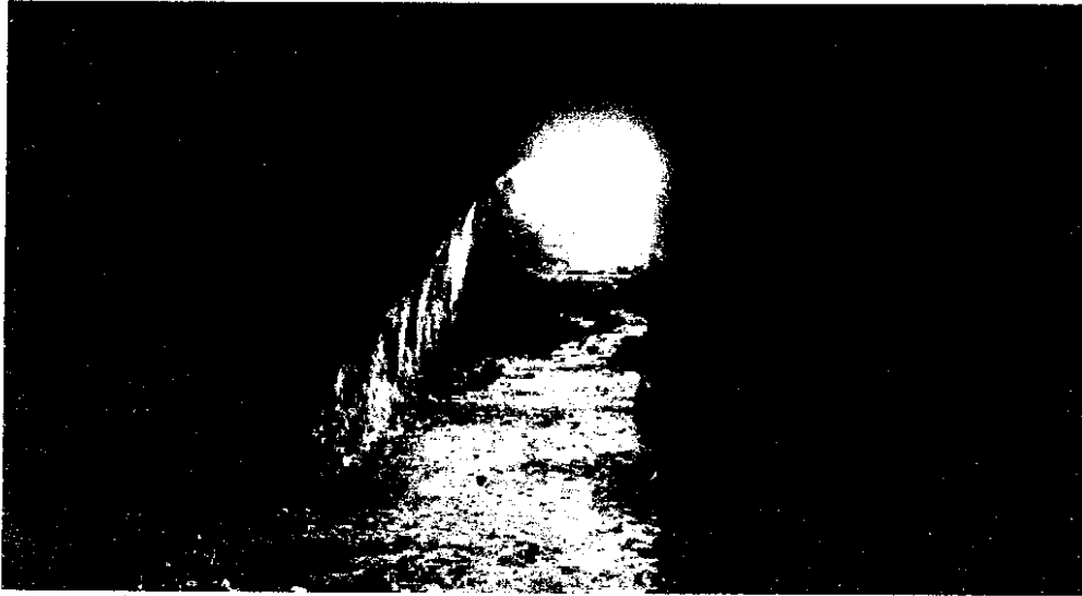
Fotografía 5: Vista desde el interior de la cueva artificial ubicada en la ladera sur del Cerro Mariman o de Negrete. Originalmente presentó unos 31 m de largo y actualmente tiene unos 25 m, debido al derrumbe del techo. Su alto actual es de unos 3.1 m y su ancho es de 4.07 m en la parte inferior y 3.7 m en su parte media. Este tipo de cuevas se encuentra en otros espacios en que hay fortificaciones, por ejemplo al lado del Fuerte Santa Bárbara en el archipiélago de Juan Fernández. Fotografía de Victoriano Saez, tomado desde Panoramio de Google Eart.!