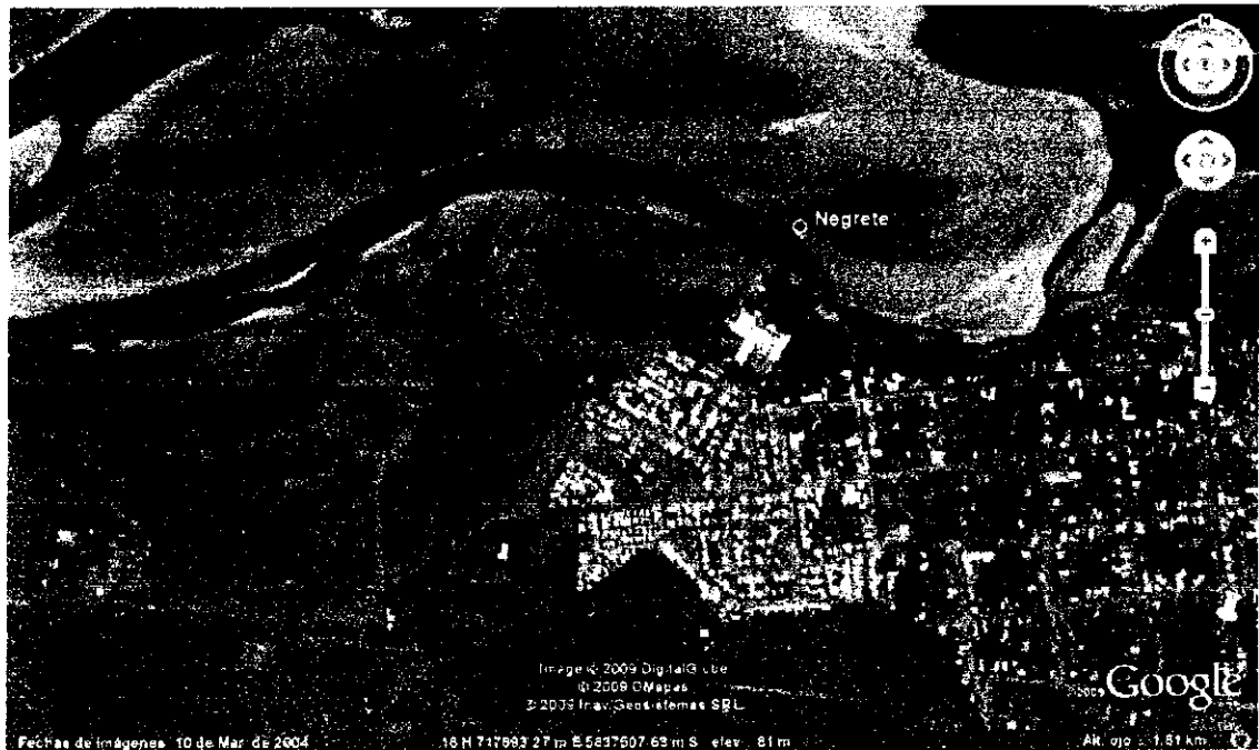
Fotografía 1: Vista general del emplazamiento de la ciudad de Negrete y cerro aledaño.