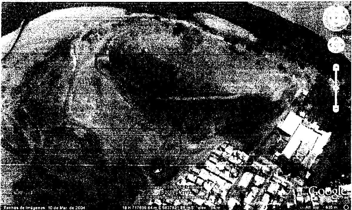
Fotografía 2: Fotografía de detalle del Cerro de Negrete o Mariman. En el círculo grande se detalla la ubicación del lugar del hallazgo del muro de adobe, y en el pequeño, la ubicación de una cueva artificial.